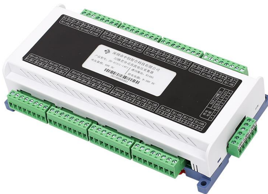
图一、产品实物图（导轨安装或螺钉）

外观尺寸：217X121X47mm，螺钉安装尺寸 197*101mm，安装孔径 \phi 4.5mm