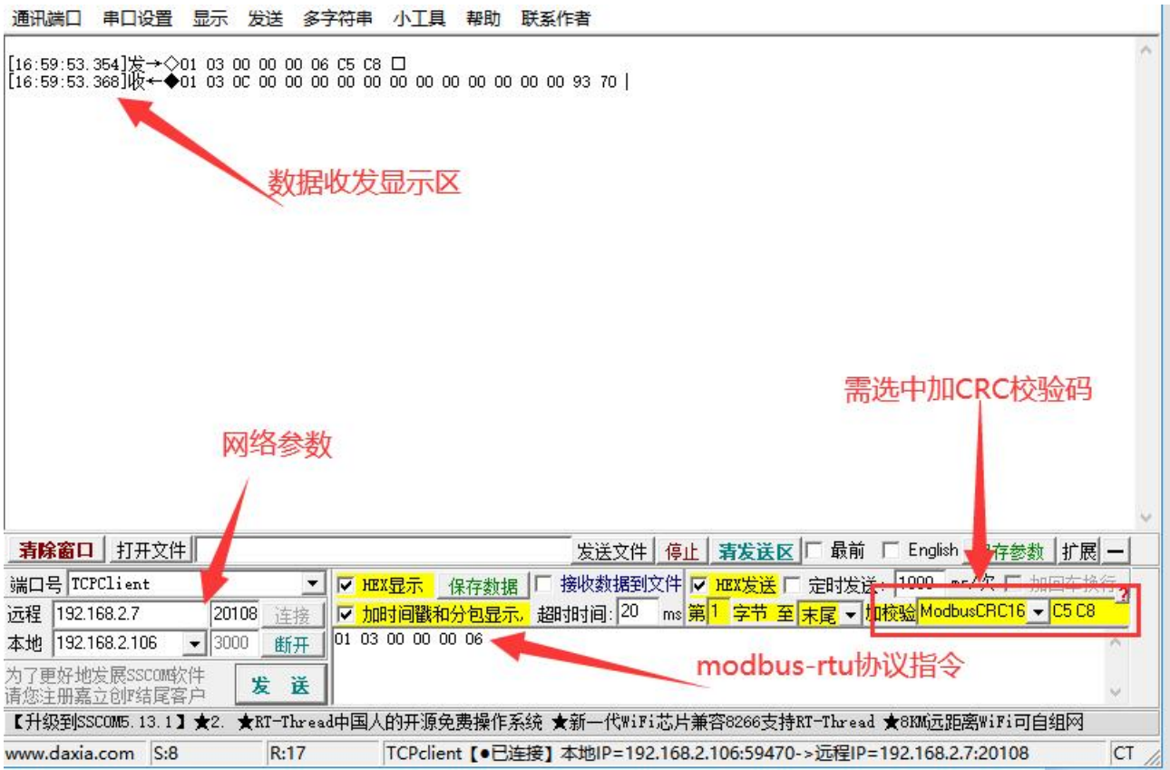
图 4、modbus-rtu 协议指令测试页面