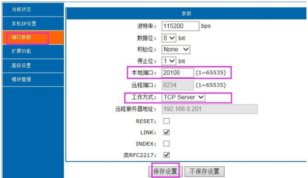
图 2、模块参数网页设置页面