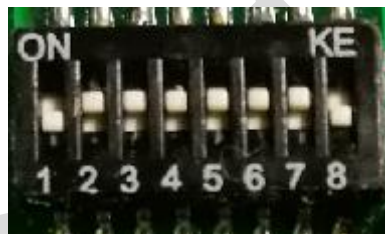
表 1: 地址码对照表

代码定义: 0--115200bps 1--9600bps 2--19200bps 3--38400bps